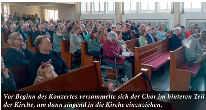
Vor Beginn des Konzertes versammelte sich der Chor im hinteren Teil der Kirche, um dann singend in die Kirche einzuziehen.