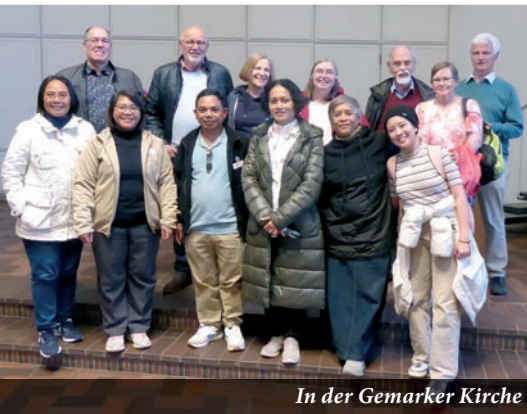
In der Gemarker Kirche

Am 12. September 2024 hatte die Niederländisch Reformierte Gemeinde (NRG) Besuch einer Delegation aus Sumba, die alle altreformierten Gemeinden besuchte.