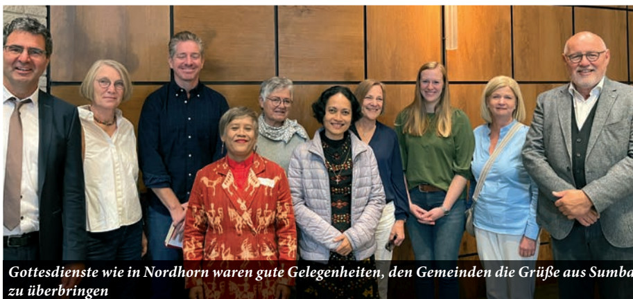
Gottesdienste wie in Nordhorn waren gute Gelegenheiten, den Gemeinden die Grüße aus Sumba zu überbringen