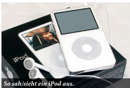
So sah/sieht ein iPod aus.

Der Begriff „Podcast“ setzt sich aus „iPod“ (dem populären MP3-Player von Apple) und „Broadcast“ (Rundfunk) zu-