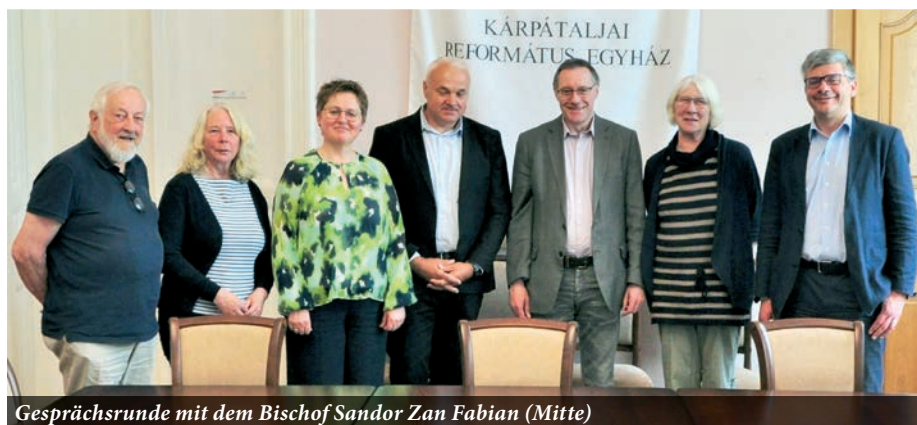
Gesprächsrunde mit dem Bischof Sandor Zan Fabian (Mitte)