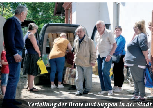
Verteilung der Brote und Suppen in der Stadt